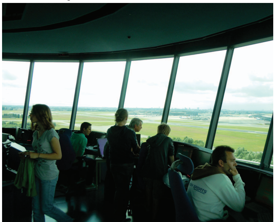
Op bezoek in de controletoren van Zaventem