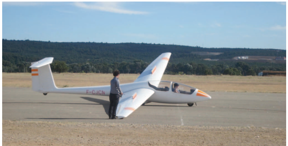
Antoine helpt me bij het vertrek.

De volgende ochtend en nog enkele dagen na mijn eerste solovlucht toerde ik nog wat rond