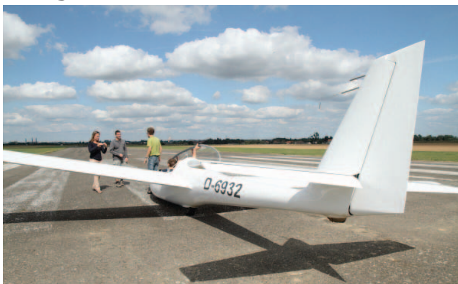
De SF34 klaar voor de volgende lesvlucht...

Alle info werd op de website gezet en er verscheen een persbericht. Al vlug liepen de inschrijvingen binnen. Ook de aanmeldingen (de mensen die er vorige keer niet meer bij konden) werden aangeschreven ... plots nog 6 inschrijvingen extra ... uiteindelijk schreven er 22 deelnemers in.