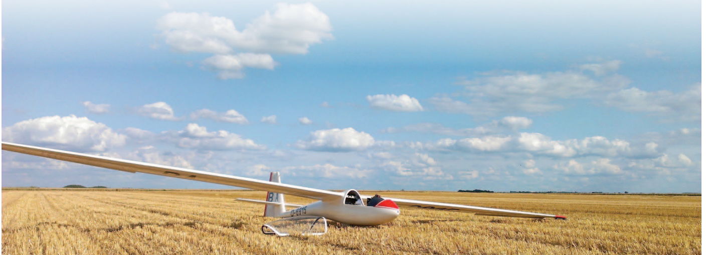
Rudi's ASW15 in 'long final' voor RWY24 (Hakendover)