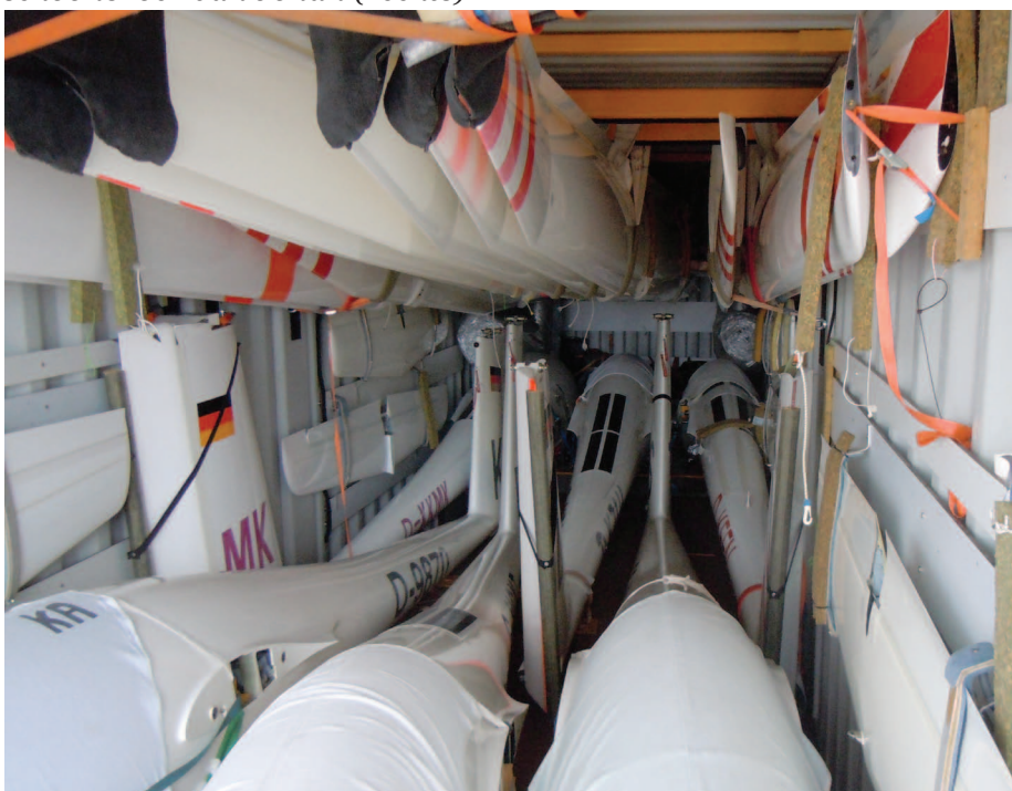
Alles erin, voorlinks de KA en voorrechts de TS

Al naar gelang de situatie in het Midden Oosten, zal het schip door het Suez kanaal varen of langs Kaap de Goede Hoop.